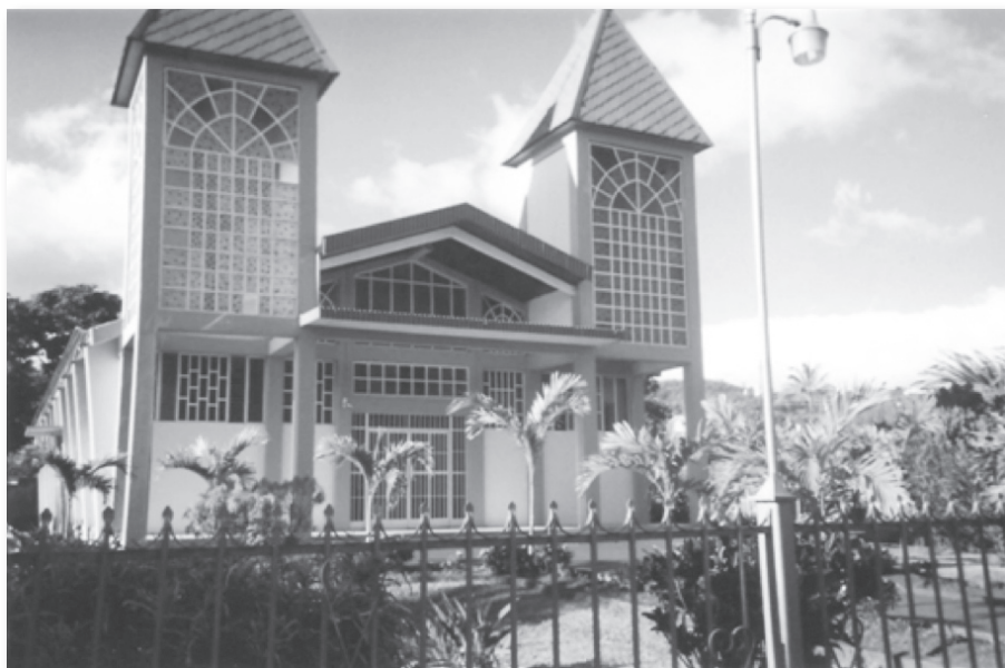
Naranjo de Alajuela

Sin embargo, muchas de las imágenes están tomadas desde una perspectiva colectiva, en donde incorporan a miembros de sus comunidades en actividades recreativas o espirituales, como el asistir a la iglesia.