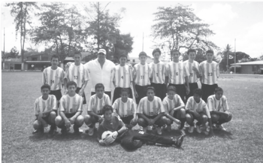
Los Chiles

Muchas de las fotografías que las/los jóvenes tomaron en relación con las diversas formas de recreación en sus comunidades, están asociadas a lo que denominamos “verde”; es decir, espacios naturales donde las imágenes muestran a jóvenes tomando el sol en algún río, imágenes de montañas y llanuras. Así, muchas de estas imágenes “verdes” muestran a jóvenes disfrutando de recursos naturales, como ríos y plazas públicas, como medio de recreación.