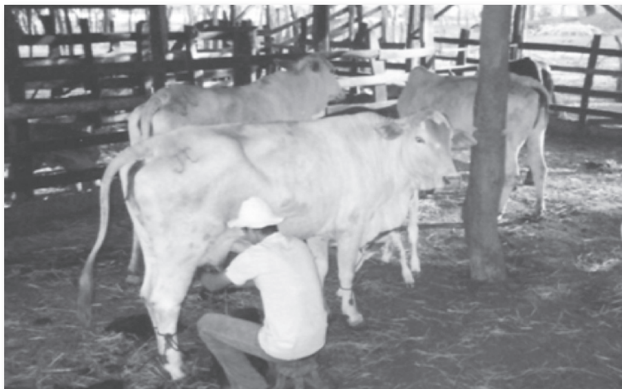
San Vicente de Nicoya

En cuanto al sector servicios, las fotografías retrataron dos en particular: los empleos informales de jóvenes en tiendas o negocios, y el trabajo en negocios o actividades familiares. Algunos fotografiaron pequeños supermercados o tiendas en donde es bastante común que los pequeños comercios contraten a personas jóvenes conocidas de la comunidad. Muchos laboran fines de semana, pero muchos otros laboran la jornada completa toda la semana.